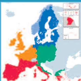
INTERREG III C (2000-2006) ■ South ■ West ■ North ■ East