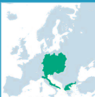
INTERREG III C (2000-2006) East