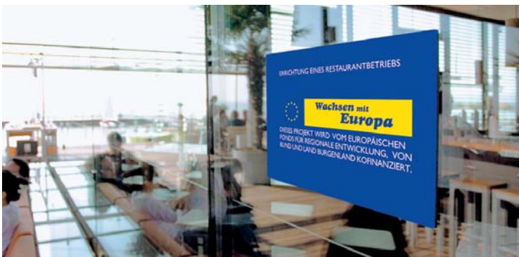
Mole West, Neusiedl am See

Vorlagen finden Sie auf www.phasing-out.at