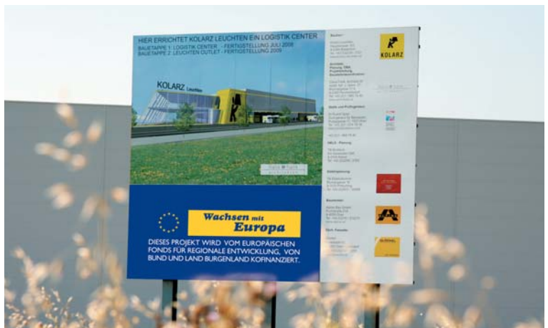
KOLARZ Leuchten, Müllendorf

DIE GRÖSSE DER TAFEL MUSS DER BEDEUTUNG DES PROJEKTES ENTSPRECHEN.