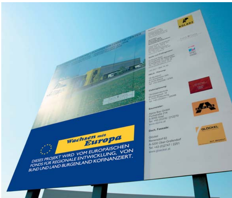
KOLARZ Leuchten, Müllendorf

mit einem Hinweis auf die Förderung durch den Europäischen Fonds für regionale Entwicklung, Bund und Land Burgenland anbringen.